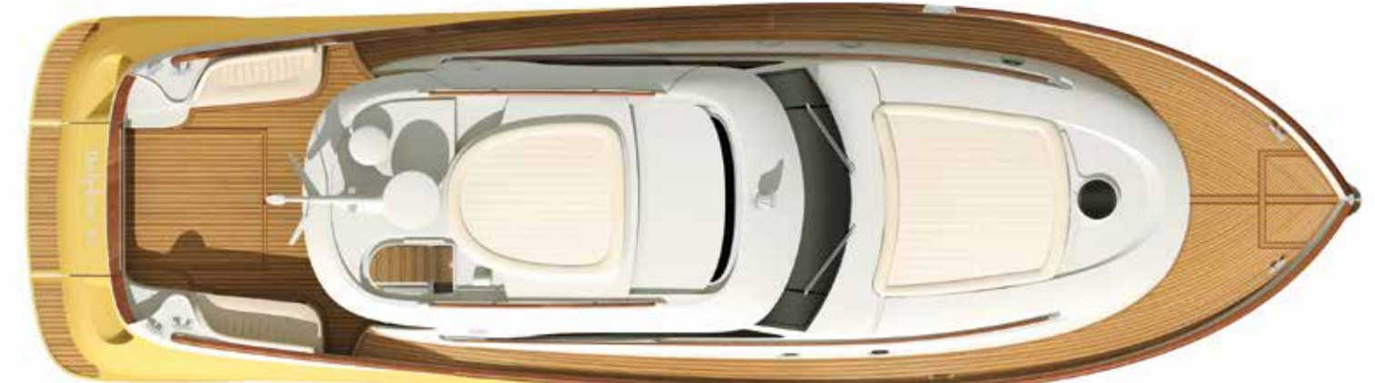
Sun Top Version