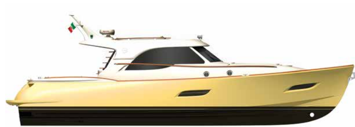
Sun Top Version