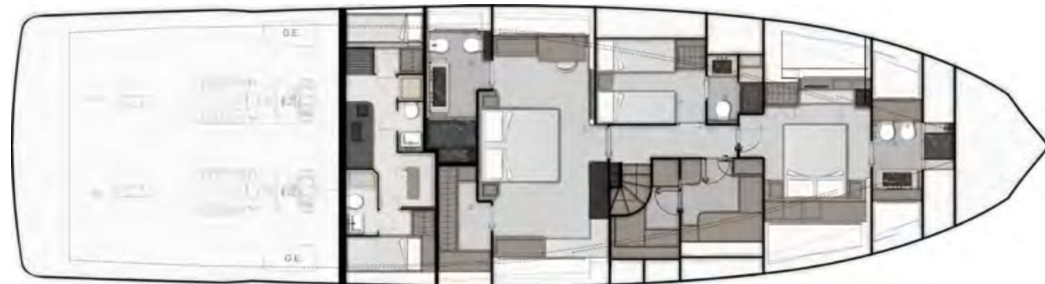
LOWERDECK OPTIONAL UTILITY ROOM