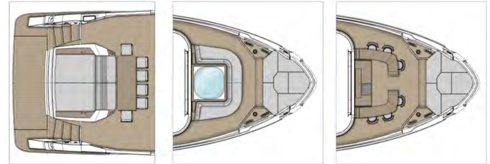
EXTERIOR CONFIGURATIONS OPTIONAL