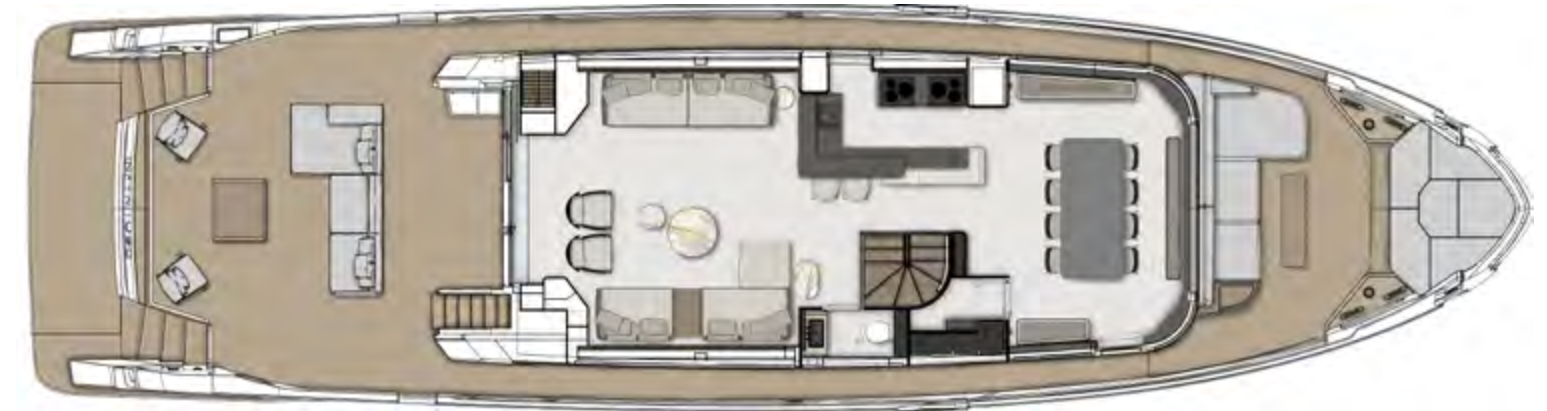
MAINDECK SHOW KITCHEN OPTIONAL