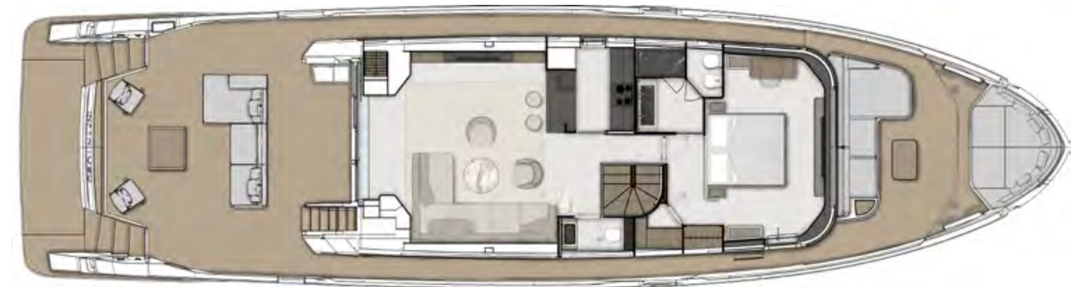
MAINDECK OWNER CABIN OPTIONAL